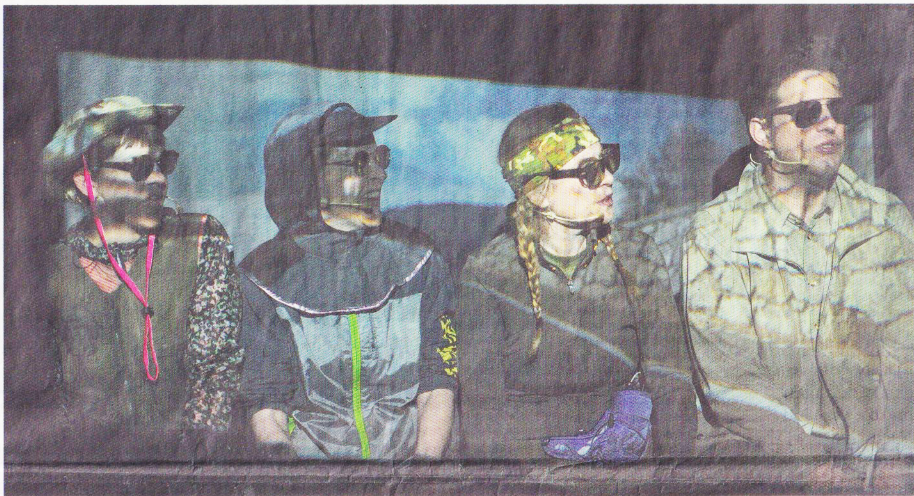
Vier Stadtmenschen auf dem Weg zu einem Survival-Trip.

Schon in den ersten Dialogen wird deutlich: Hier wird nicht nur gespielt, hier wird mit Klischees jongliert, sie werden hinterfragt, ausgestellt und mit feiner Ironie gespiegelt. Die Walliser Herkunft, die ewige Frage «Va wele bisch?», ist nur eine von vielen Eigenheiten, die